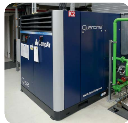
Die Quantima Q-52 in der Druckluftstation bei John Deere in Mannheim.

Der Druckluftbedarf im weitläufigen Werk ist groß, was u. a. auch auf die hohe Fertigungstiefe zurückzuführen ist. Entsprechend gut ausgestattet ist die zentrale Druckluftstation. Hier waren bis vor gut einem Jahr sechs Turboverdichter im Einsatz, die bis zu 350 m 3 /min ins 6,5 bar-Werkluftnetz speisten, und zusätzlich ein kleinerer drehzahl geregelter Schraubenkompressor für Wochenendschichten.